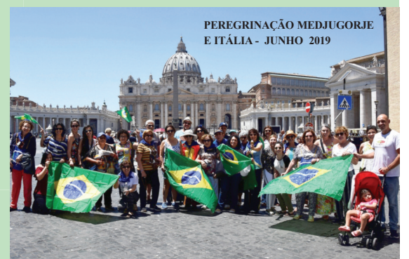
PEREGRINAÇÃO MEDJUGORJE E ITÁLIA - JUNHO 2019

ENTRE EM CONTATO CONOSCO: ■ SECRETARIADO RAINHA DA PAZ: (31) 3273-8654 - rainhadapazbh@hotmail.com ■ PRISMAZUL: (11) 5572-2697 - prisma.turismo@uol.com.br