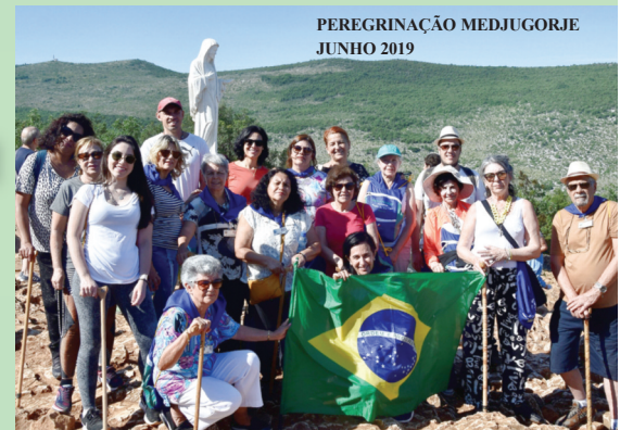
PEREGRINAÇÃO MEDJUGORJE JUNHO 2019