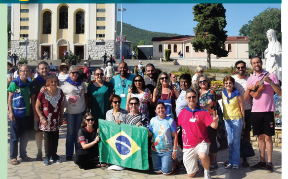
PEREGRINAÇÃO FESTIVAL DE JOVENS EM MEDJUGORJE - 2019