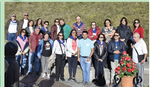
PEREGRINAÇÃO LA SALETTE - SETEMBRO 2019