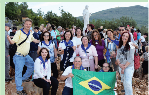
PEREGRINAÇÃO MEDJUGORJE - SETEMBRO 2019