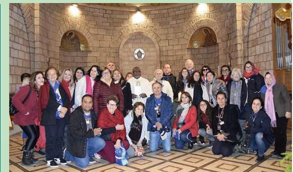
PEREGRINAÇÃO TERRA SANTA - FEVEREIRO 2020