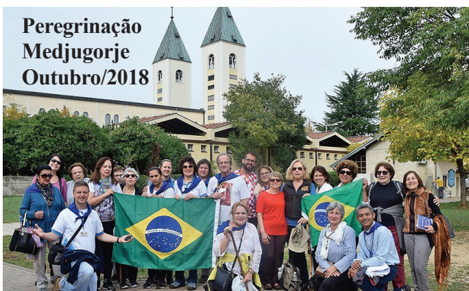
Peregrinação Medjugorje Outubro/2018